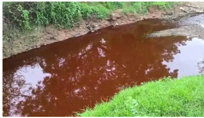
આ એક માનવવધ જેવું કૃત્ય કહેવાય: ધર્મેન્દ્રસિંહ વાઘેલા

એટલે બેડૂતો ખેતી કરી શકતા નથી કે પાણી પી પણ શકતા નથી. એટલે આ બહુ ગંભીર ઘટના છે અને આ ફરીવાર ન બને તે માટે થઈને અમે અધિકારીઓને પણ સૂચના આપી છે. સરકારમાં પણ મંત્ર લખીની આવા વ્યક્તિઓ વારંવાર જે આ કૃત્ય કરતા હોય તેમનું લાયસન્સ રદ કરવા જણાવ્યું છે. ગુજરાત પ્રદૂષણ નિયંત્રણ બોર્ડ (GPCB)ના રીજીનલ ઓફિસર જે.એમ. મહિડાએ આ મામલે નિવેદન આપતાં જણાવ્યું હતું કે, નંદેસરી GIDC વિસ્તારમાં આવેલી ત્રણ કંપનીઓ દ્વારા નિયમોનું ઉલ્લંઘન કરીને કેમિકલ યુક્ત દૂષિત પાણી નદીમાં છોડવામાં આવી રહ્યું હોવાનું તપાસમાં સામે આવ્યું છે. આવી પ્રવૃત્તિ પર્યાવરણ અને જનસ્વાસ્થ્ય માટે ખૂબ જ નુકસાનકારક છે. આ ત્રણેય કંપનીઓને તાત્કાલિક અસરથી ક્લોઝર નોટિસ આપવામાં આવી છે અને તેમના વીજ કનેક્શન કાપવાની કાર્યવાહી પણ શરૂ કરવામાં આવી છે. અમે આવા કૃત્યો સામે કડક કાર્યવાહી કરવા પ્રતિબદ્ધ છીએ.